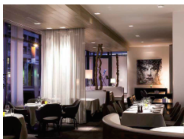
Hotel Pullman Eindhoven Cocagne