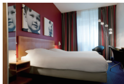
Inntel Hotels Amsterdam Centre